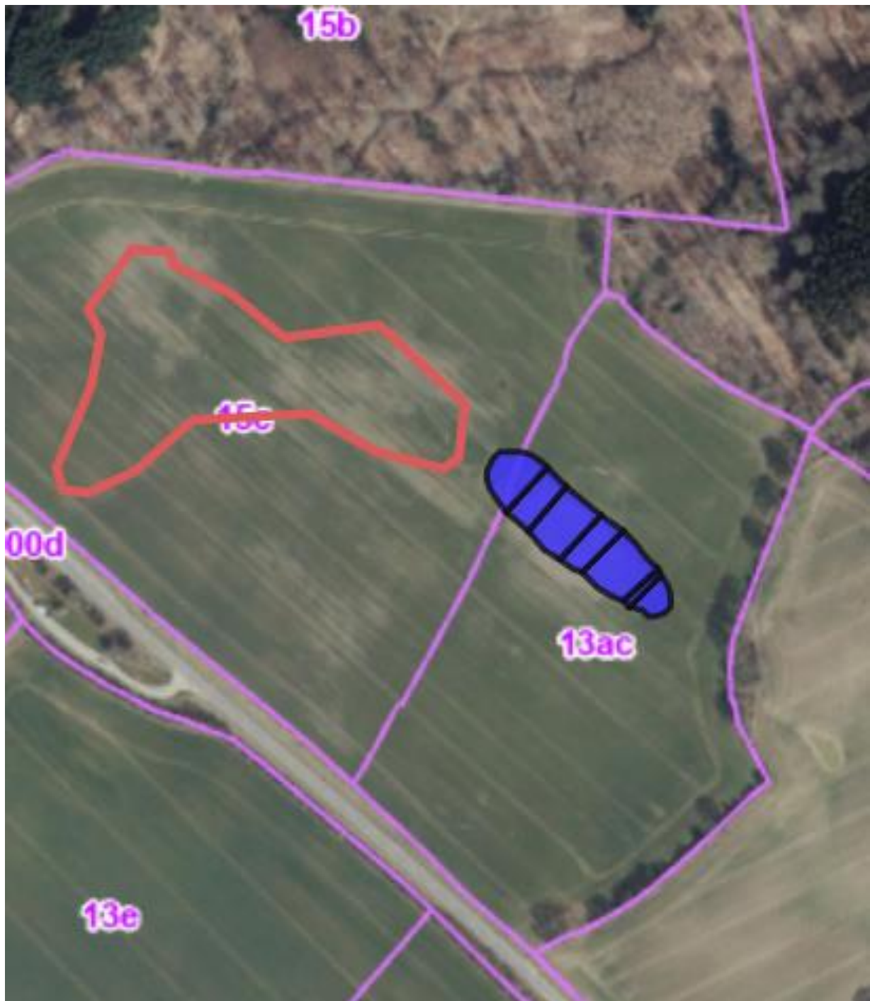
Kortbilag 3. Placering af minivådområde er skraveret med blå. Overskudsjoeden placeres inden for de røde linjer. Før udlægning afgraves muldjorden delvist (cirka 15 cm). Jorden lægges herefter ud i max 0,5 meters højde.