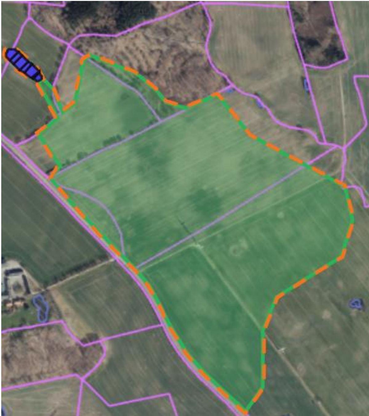
Kortbilag 4. Drænolandet er markeret med grønt, projektområdet er orange, og minivådområdets vandspejl er blå.