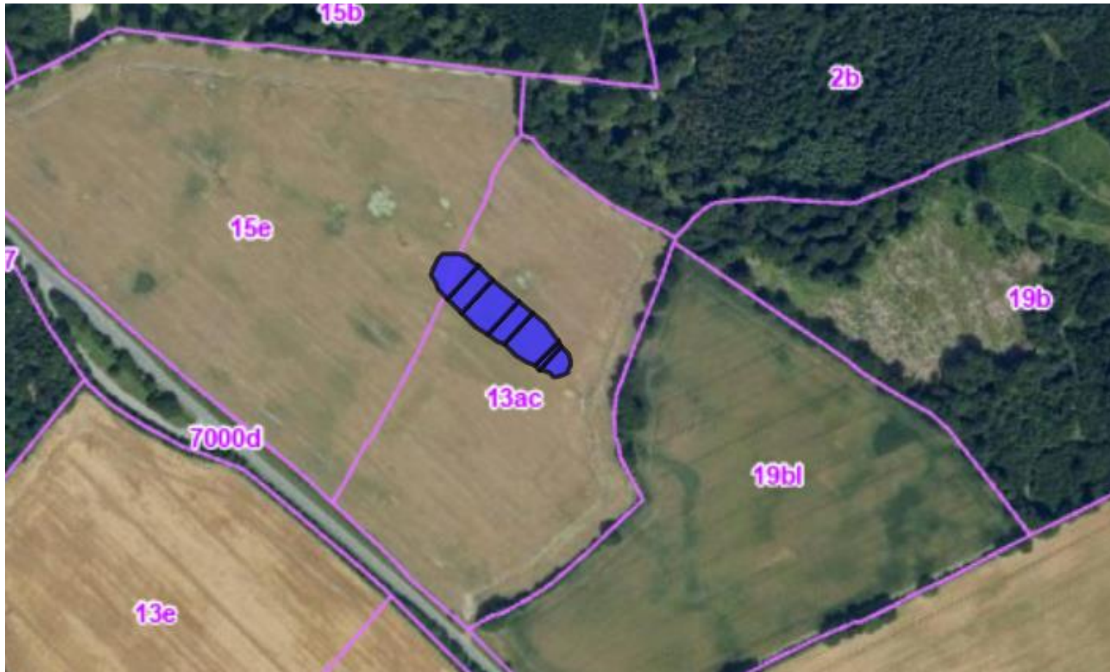
Kortbilag 2. Oversigtskort, der viser minivådområdets placering på matriklen.